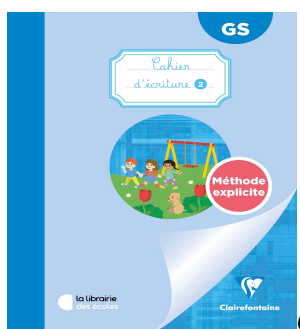
Cahier d'écriture n°2, Clairefontaine, GS - Edition La librairie des écoles