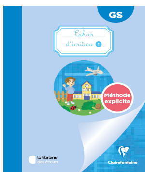
Cahier d'écriture n°1, Clairefontaine, GS - Edition La librairie des écoles