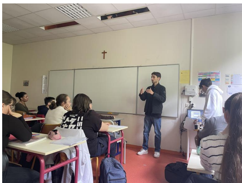
Intervention d'une association sur le handicap