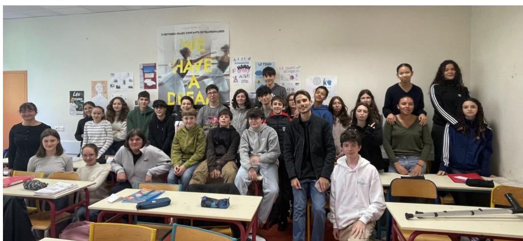
Classe de 4D